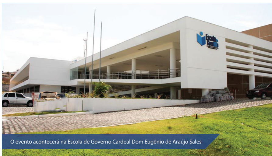
O evento acontecerá na Escola de Governo Cardeal Dom Eugênio de Araújo Sales

O encerramento do encontro acontece às 15h30 com a realização de uma mesa redon-