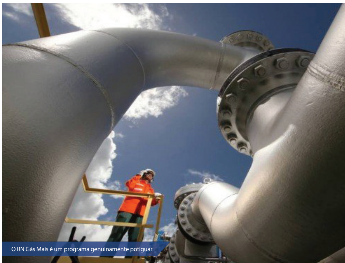
O RN Gás Mais é um programa genuinamente potiguar

O RN Gás Mais é um programa genuinamente potiguar de incentivo ao desenvolvimento econômico por meio do subsídio de Gás Natural Canalizado para as indústrias, benefício único no Brasil. Ele oferece subsídio no preço da venda de gás a empresas enquadradas no programa. Os percentuais de desconto estão condicionados a uma série de requisitos. O principal deles é a oferta de empregos aos norte-rio-grandenses. A operacionalização do RN Gás Mais envolve o Governo do Estado, por meio da Secretaria de Desenvolvimento Econômico, Idema e Companhia Potiguar de Gás (Potigás).