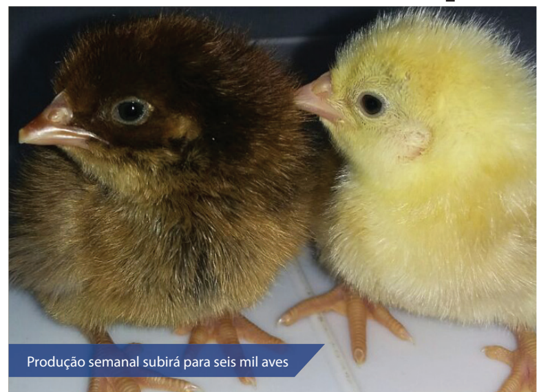
Produção semanal subirá para seis mil aves

O processo de incubação, acompanhado por pesquisadores e técnicos da EMPARN especialistas em produção animal, possibilita aumentar a produtividade e os controles sanitários. As linhagens produzidas pela empresa são de dupla aptidão, ou seja, indicadas para produção de ovos e carne. Durante todo o ano, os pedidos são atendidos na Estação Experimental de Caicó e, em outras estações, como a da sede da empresa, no Jiqui, em Parnamirim. Os pintos são entregues semanalmente, sempre às quintas-feiras.